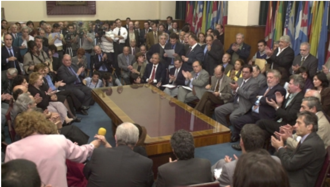
Autoconvocatoria Multisectorial que reunió a legisladores, gremialistas, asociaciones de consumidores, entidades médicas y farmacéuticas en defensa de la prescripción de medicamentos por nombre genérico.

Los ministros de Salud de todas las provincias argentinas aseguraron que “todos los medicamentos disponibles en farmacias responden a un nombre genérico, y la prescripción por ese nombre genérico es una recomendación de la OMS (Organización Mundial de la Salud) y de la OPS (Organización Panamericana de la Salud)”.